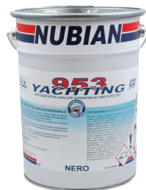
Latta da 5 Lt.