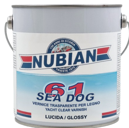
Latta da 2,5 Lt.