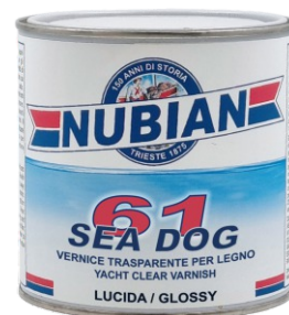
Latta da 750 ml.